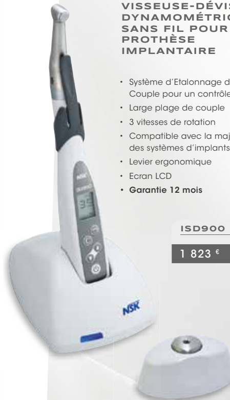
Calibreur de couple